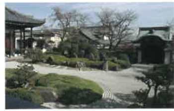
5 正法寺 [重文] 室町時代は後奈良天皇の勅願寺、後に徳川家康公の側室、お亀の方(相応院)の菩提寺として発展。重要文化財を多数所蔵するほか、庭園は府の名勝に指定。