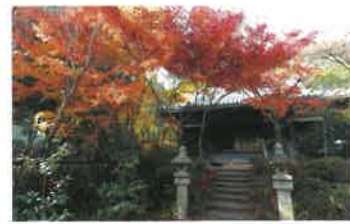
4 善法律寺 石清水八幡宮の検校職であった善法律寺宮清が自分の邸宅を僧坊として寄進し、奈良東大寺より実相上人を招いて開山。別名「もみじ寺」。