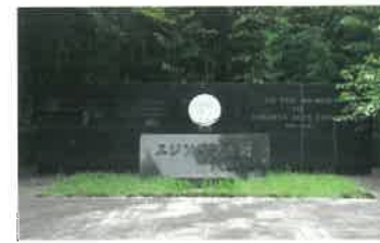
7 エジソン記念碑 トーマス・エジソンが八幡産の真竹を使って白熱電球の1000時間点灯に成功し、実用化に至った。石碑は戦前の1934年から守り継がれ、エジソンの偉業を称えている。