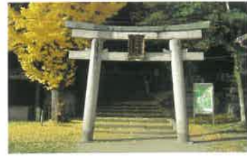
9 高良神社 石清水八幡宮の麓、頓宮の南に鎮座する八幡の氏神さん。兼好法師が著した徒然草第52段の逸話が有名。