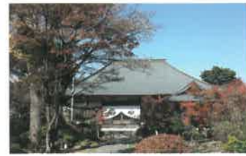
8 神應寺 [重文] 貞観元年(860)に石清水八幡宮を開いた行教が創建。重文の行教律師座像や、豊臣秀吉の衣冠束帯の像を安置。