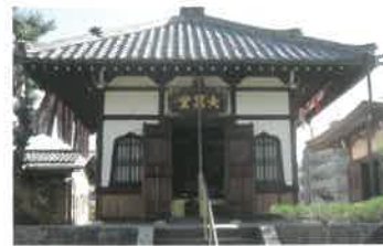
3 単伝庵(らくがき寺) 大黒様に願いごとが見えやすいように、壁に願いを書き入れる「落書き祈願」ができるユニークな寺。