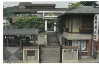
1 飛行神社 日本で初めてゴム動力のプロペラ式飛行機を発明した二宮忠八氏創建の神社。忠八ゆかりの資料などを鑑賞できる資料館も。