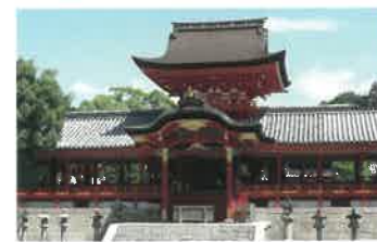
6 石清水八幡宮 [国宝] 日本三大八幡宮のひとつ。現社殿(国宝)は三代将軍・徳川家光の造営。