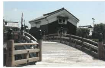
2 安居橋 男山の麓を流れる放生川に架かる橋で、八幡八景の一つ。別名「たいこ橋」。