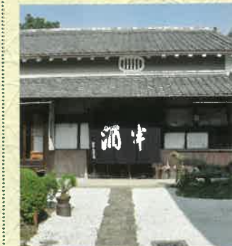
守口宿:文徳庵薩摩英園館