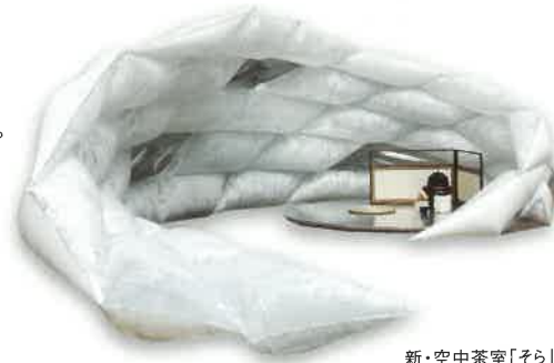
新・空中茶室「そら」

東京藝術大学と共同で制作した、新・空中茶室「そら」を使用したお茶会を開催します。 茶室の横では雅楽を演奏。雅楽の調べを聴きながらの優雅なお茶会に、ぜひご参加ください。