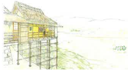
閑雲軒復元イメージ図