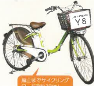
龍山までサイクリング ロードで約20km!

1回1台のご利用ごとにスタンプを1個押します。スタンプが5個たると、指定店舗で利用できる500円の金券を進呈します。