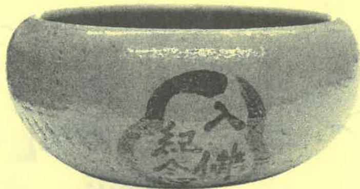
上から 南山焼鳩香合/月に梅文湯呑/赤楽「入佛紀念」鉢 いずれも松花堂美術館蔵