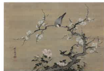
1. 狩野安信「松竹梅図屏風」(個人蔵) 2. 歌川広重(三代)「花盛四季之園中のうち」(個人蔵) 3. 松花堂昭乗「雉子図 松花堂画寄合賛絵巻のうち」(当館蔵) 4. 阿岐山「梅に文鳥図」(個人蔵)