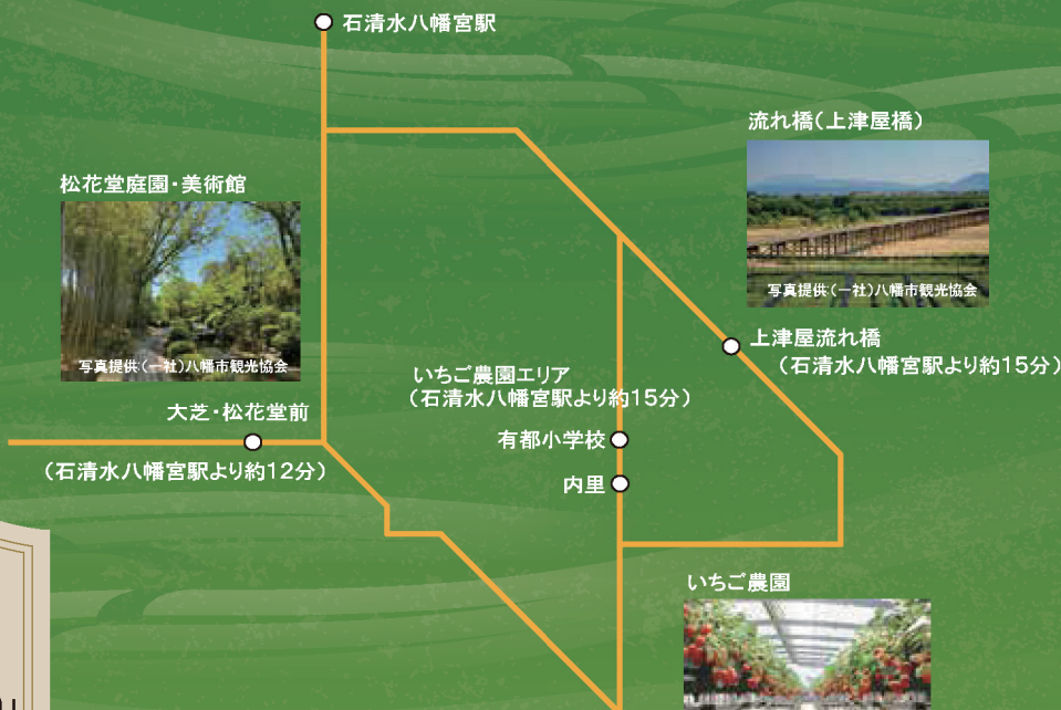
《八幡エリア 京阪バス路線図》

石清水八幡宮をご参拝のあとは、八幡市をはじめとするお茶の京都エリアを路線バスで周遊しませんか？ お茶の京都エリア内の路線バスが一日乗り放題の「もうひとつの京都周遊パス(お茶の京都エリア)」は「松花堂庭園・美術館」、「流れ橋(上津屋橋)」、「内里のいちご農園」など、八幡市内の魅力溢れるスポットを巡っていただくのに便利な乗車券です♪