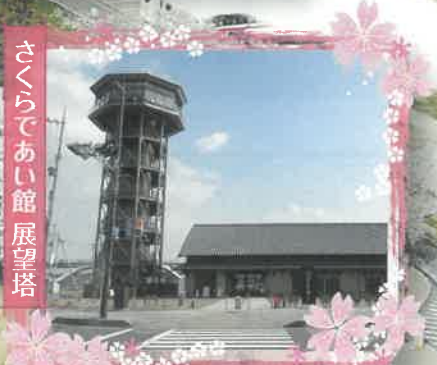
さくらであい館 展望塔